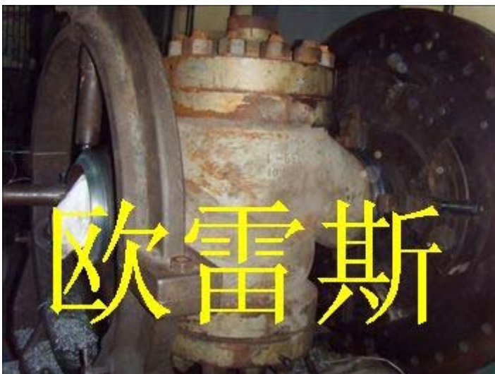
高压闸阀维修拆卸中