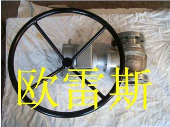
硬密封球心维修后