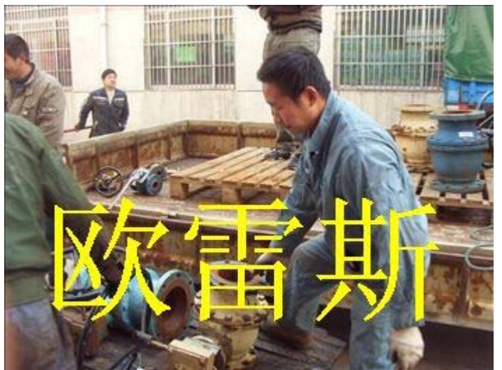
排渣闸阀维修拆卸中