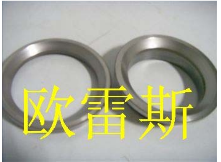
高压阀门维修坡口