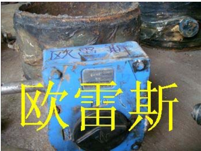
进口蝶阀维修照片