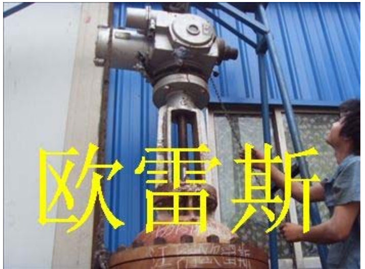
阀门维修厂 阀门修理厂