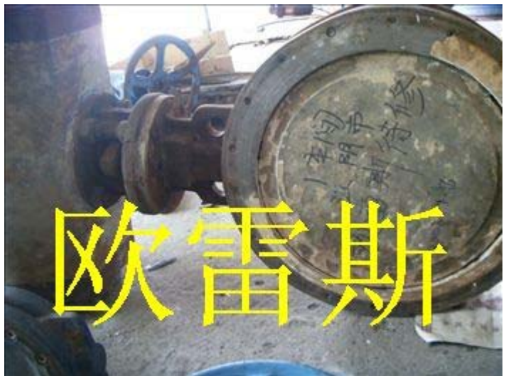
气动蝶阀维修照片