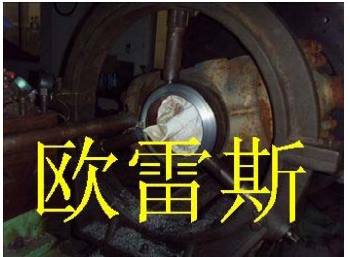
硬密封球阀维修卸货